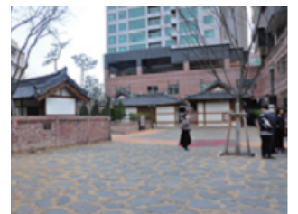
12 대구 옛골목