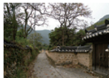
22 둔산동 경주최씨종택 (대구 웃골마을)