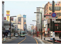
14 대중교통전용지구 (중앙대로)