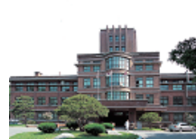
11 경북대학교병원 (대구의학전문학교 본관, 도림대구병원)