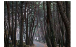
24 북지장사 가는 길