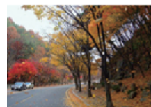
23 팔공산 순환도로 (파계사~시민안전테마파크)