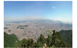
28 앞산 전망대