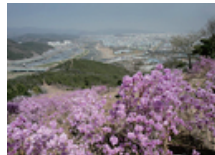
26 와룡산 진달래군락지