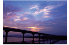
44 사문진 낙조