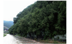
16 도동 측백나무 숲