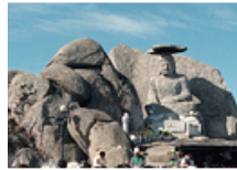
18 팔공산 깃바위