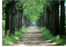
38 호산동 메타세콰이어숲길