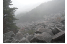
40 비슬산 암괴류