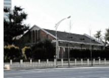
10 경북사대부설중고교 역사관 (대구사범학교 본관)