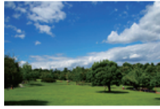
01 달성공원 (달성공원)