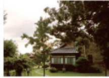
06 계산동 동산의 선교사주택지