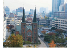
07 계산성당 대구대교구 주교좌성당계산천주교회