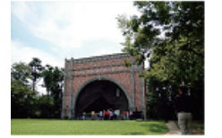
08 남산동 성모당 (남산동 가톨릭타운)