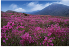
41 비슬산 참꽃