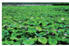
25 반야월 연밭길 (안심습지)