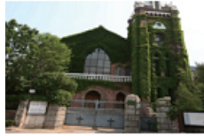
09 제일교회(남성로 50번지)