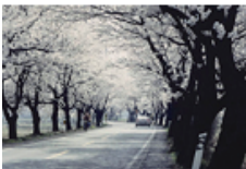
49 용연사 벚꽃길