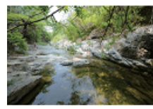
27 앞산 고산골 공룡화석터