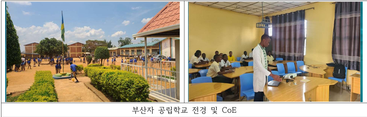
부산자 공립학교 전경 및 CoE