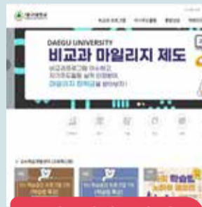
1 비교과시스템 접속