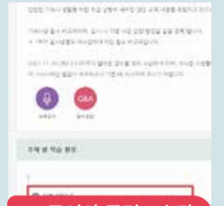
6 동영상 클릭 - 수강