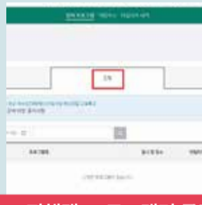
4 진행탭-프로그램명 클릭